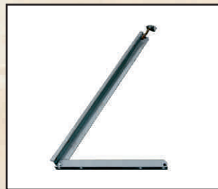
podpora panela kod orion123