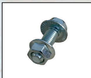
śruba łącząca panele kod orion126