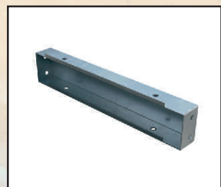
podwyższenie 10 cm kod orion128