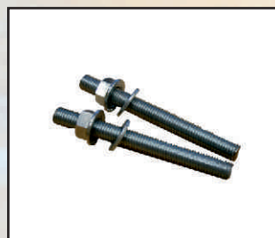
śruba kotwiąca kod orion127