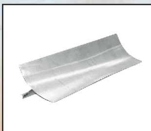
narożnik wewnętrzny kod orion124