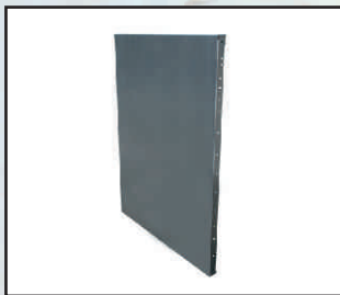
panel szer. 1 m kod orion120