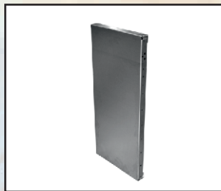
panel szer. 0,5 m kod orion121