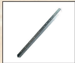
łącznik panela w narożniku kod orion125