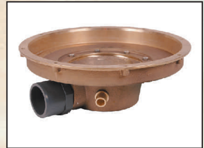
z oświetleniem kod 378713