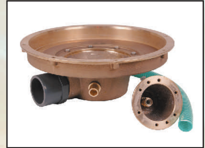
z oświetleniem kod 378751