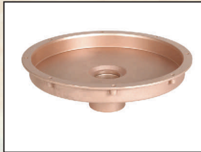
pionowy 2" kod 378703