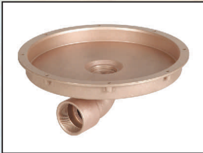
poziomy 2" kod 378701