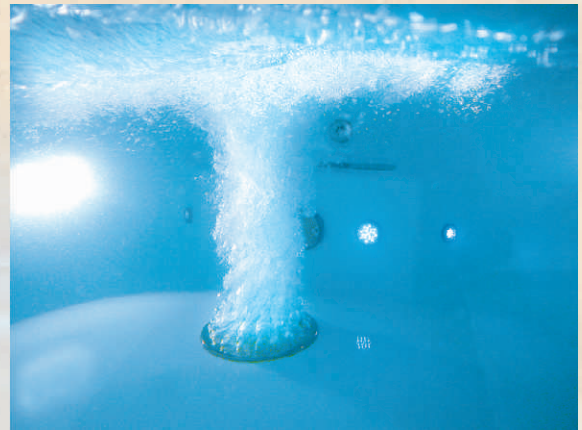
końcowy z oświetleniem 50W kod 378753