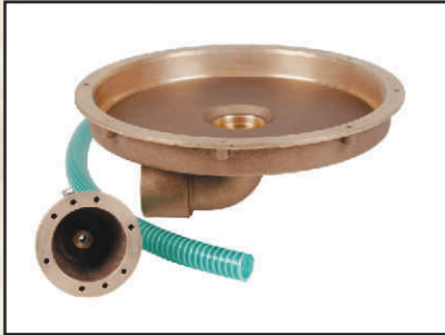
poziomy 2" kod 378700