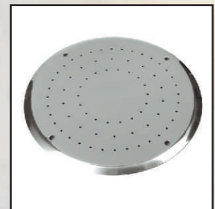
pokrywa kod 378760