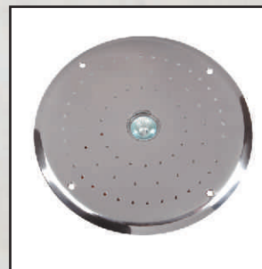
lampa 50W kod 378762 LED 4x3W RGB kod 378764