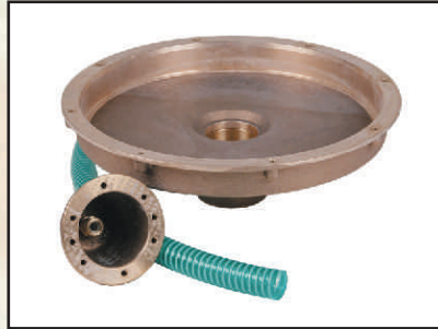
pionowy 2" kod 378702