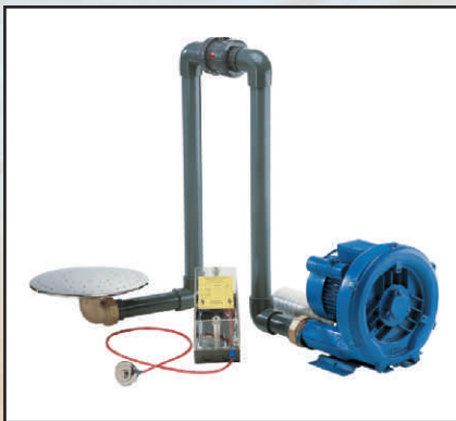
końcowy bez oświetlenia kod 378710