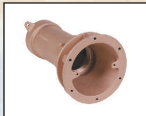
DN 65, GW 2 1/2", 60 m 3 /h, kod 324631