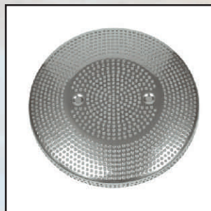
pokrywa kod 324635 uszczelka 375102