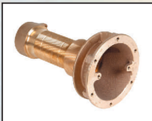
DN 65, GW 2", 48 m 3 /h, kod 324630