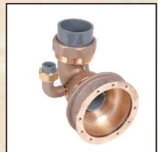
KW63mm kod 8663450