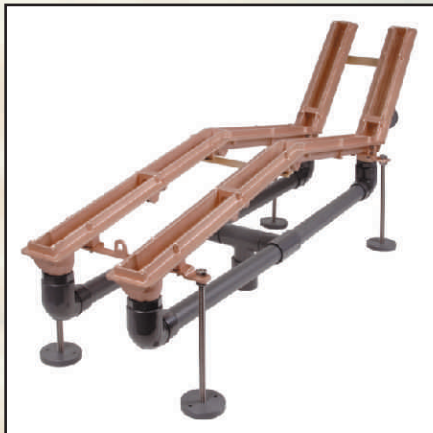
zestaw montażowy płytka kod 375070 pokrywy stalowe (2 szt.) kod 8755020