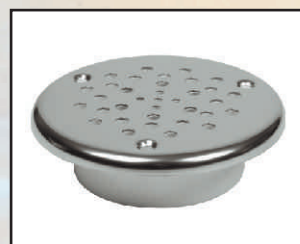
pokrywa kod 324638 uszczelka 375102