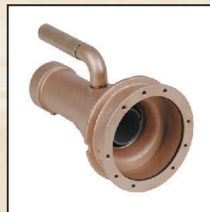
GW 2" kod 324633