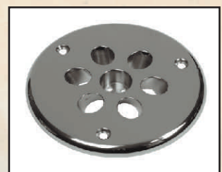
pokrywa kod 324639 uszczelka 375102