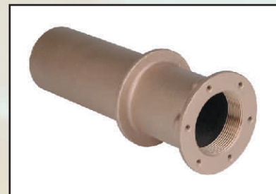
przepust kod 324600 uszczelka kod 324540