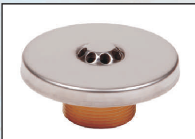
dysza masażu kod 8669420 uszczelka dyszy masażu