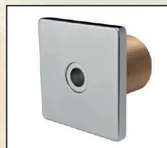
dysza 40 mm kod 3140020 dysza do folii kod 3140220