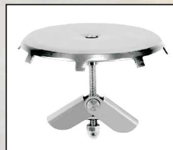
maks. 25 m 3 /h kod 87198033 do śr. 50-63 mm maks. 40 m 3 /h kod 87198034 do śr. 63-75 mm