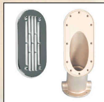
dysza z pokrywą kod 8780000 kołnierz z uszczelką kod 8782050 kolano dyszy 90° kod 8782250 kolano dyszy 60° kod 8782350