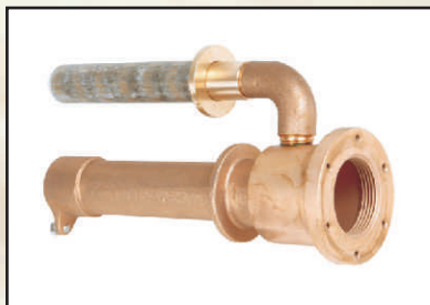
dysza tłoczna kod 8669850