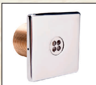
dysza 40 mm kod 3140320 dysza do folii kod 3140520