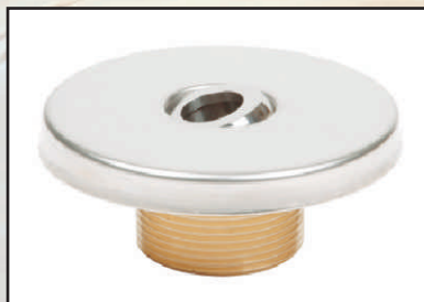
dysza masażu kod 8669220 uszczelka dyszy masażu kod 8669550