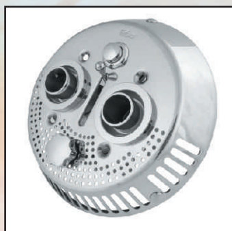
włacznik pneumatyczny kod 7309920 kołnierz z uszczelkami kod 374210