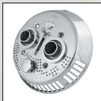
włacznik piezo – dotykowy kod 87309920 kołnierz z uszczelkami kod 374210