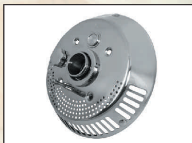
włacznik piezo – dotykowy kod 77307020 kołnierz z uszczelkami kod 374210

Zestaw montażowy Tajfun DUO Jet – oryginalny wykonany ze wysokogatunkowego stopu brązu