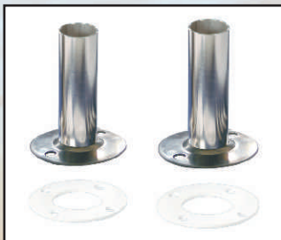
kołnierze kod 30022