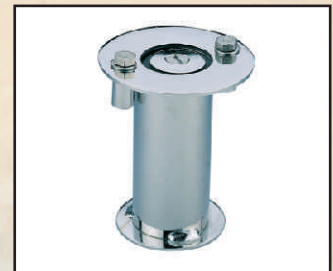
tuleja kod 30024