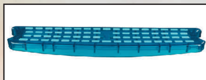
kolor niebieski kod 30082