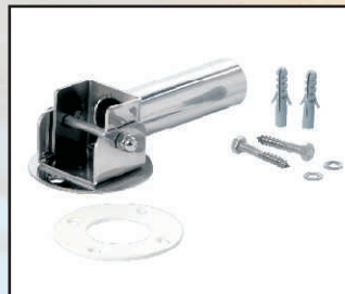
przechyłne kod 30011