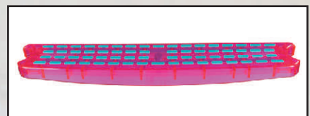
kolor różowy kod 30084