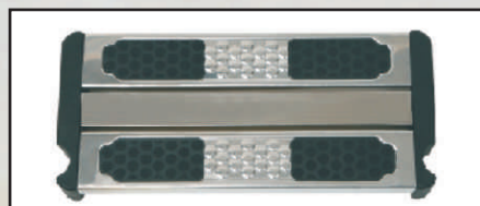
stopień bezpieczeństwa kod 07603