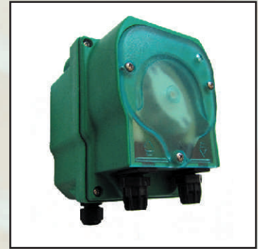
EFka106, maks. 1 l/h regulacja wydaj. kod 25368