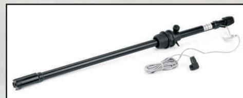
lanca ssaca kod 416694