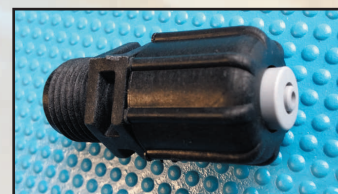
wtrysk GZ 1/2" kod 416632