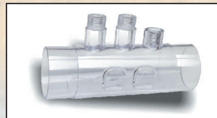
komora elektrod GW 3/8" kod 416638 wężyk dozujący 6 mm kod 8701001 złączka do elektrod kod 416640