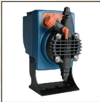
PX maks. 5 l/h kod 25358