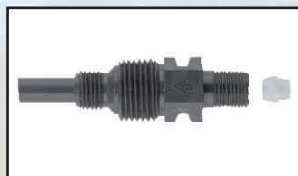
wtrysk GZ 1/4" - 1/2" kod 416630