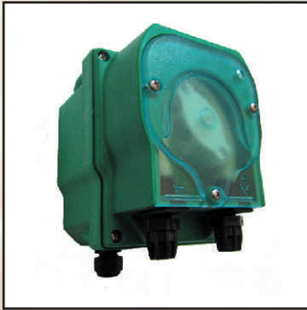
EFka105, maks. 4 l/h kod 25366