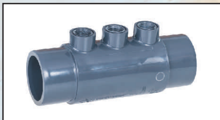
komora elektrod 50/63 mm x gw 1/2" kod 416636 wężyk wody pomiarowej 10 mm kod 8701000 zaślepka GZ 1/2" kod 730020