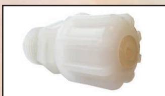
wtrysk z kulką GZ 1/2" kod 416633