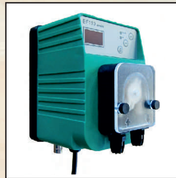
Cyfrowo sterowana z pomiarem EFka 110, max.1,8 l/h kod 25370 zestaw pomiaru pH kod 25372 zestaw pomiaru Redox kod 25374