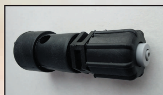
nypel ssący ze zbiornika kod 148072