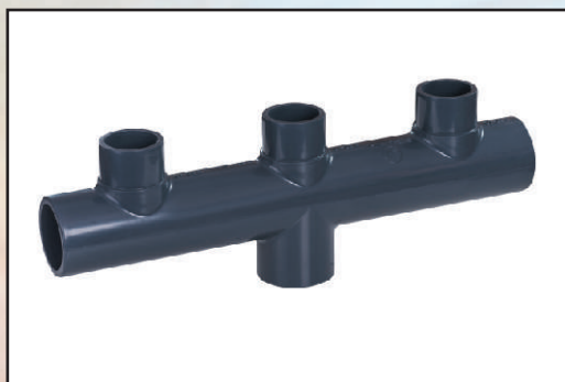
50 mm, wejście centralne kod 658242