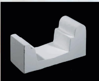
Standard kod 19700

Gotowe rynny basenowe wykonane maszynowo z milimetrową dokładnością, prefabrykaty gotowe do montażu. Prosta, estetyczna rynna Standard o idealnych wymiarach; wykładana jest folią, mozaiką lub malowana farbą epoksydową.