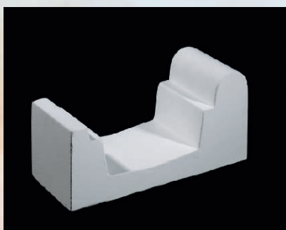
standard kod 19700

Gotowe rynny basenowe wykonane maszynowo z milimetrową dokładnością, prefabrykaty gotowe do montażu. Prosta, estetyczna rynna Standard o idealnych wymiarach; wykładana jest folią, mozaiką lub malowana farbą epoksydową.