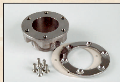
odpływ rynny kod 3941000

Gotowe rynny basenowe wykonane maszynowo z milimetrową dokładnością, prefabrykaty gotowe do montażu. Prosta, estetyczna rynna Standard o idealnych wymiarach; wykładana jest folią, mozaiką lub malowana farbą epoksydową.