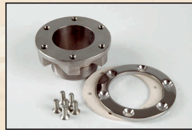
odpływ rynny kod 3941000

Gotowe rynny basenowe wykonane maszynowo z milimetrową dokładnością, prefabrykaty gotowe do montażu. Prosta, estetyczna rynna Standard o idealnych wymiarach; wykładana jest folią, mozaiką lub malowana farbą epoksydową.