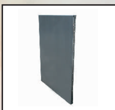
panel szer. 1 m kod orion120

Montaż zbiornika zajmuje 2-3 godziny. Z paneli ORION można skonfigurować zbiornik przelewowy w dowolnym wymiarze o wysokości 140 cm. ORION to samonośna konstrukcja. Panele stawiane są na twardym podłożu, skręcane ze sobą śrubami, a podpory mocowane są kotwami klejonymi chemicznie.