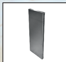
panel szer. 0,5 m kod orion121