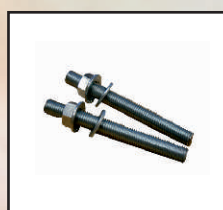
śruba kotwiąca kod orion127