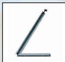
podpora panela kod orion123