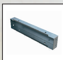
podwyższenie 10 cm kod orion128