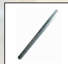
łącnik panela w narożniku kod orion125