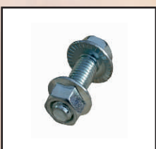
śruba łącząca panele kod orion126