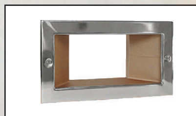
poszerzenie kod 302515 ramka kod 302520 uszczelka kod 302525

Umożliwia szybkie zbieranie wody z większej powierzchni. W komplecie śruby i uszczelka do połączenia ze skimmerem.