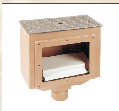
wyście 1 x GW 2" kod 301930 2 x GW 2" kod 301925

Skimmer o głębokości montażu 160 mm. Cały mieści się w świetle muru basenu.