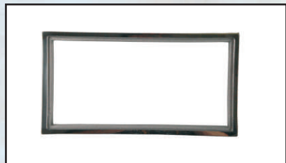
rama skimmera kod 301916 rama regulatora kod 301918