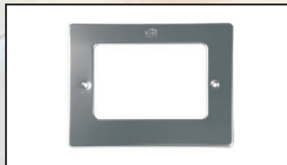
maskownica folia kod 302228 mozaika kod 302236