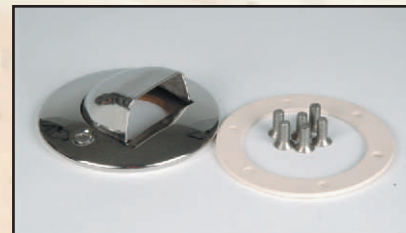
muszla kod 324663

Kompletny skimmer do basenu foliowego tworzą: 301930 lub 301925 + 302228 + 301916