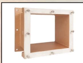
długość 50 mm kod 302410 100 mm kod 302414 300 mm kod 302511

Przedłuża szyję skimmera. Można je łączyć. Mogą zostać zabetonowane. Śruby i uszczelki są niezniszczalne.