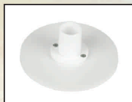
przyłącze węża 38 mm kod 302300