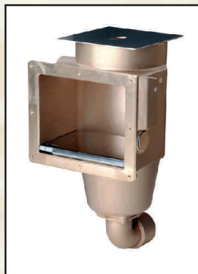
wyjście 1 x GW 2" kod 301914 2 x GW 2" kod 301906

Skimmer o głębokości montażu 240 mm. Posiada podłączenia przelewu do kanału. i regulacji poziomu wody.