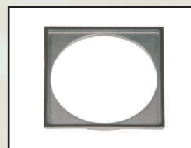
rama kod 302910