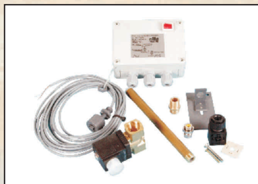
regulator poziomu kod 302775

Podłączany do skimmera. Czujnik umieszczony w specjalnej komorze skimmera.