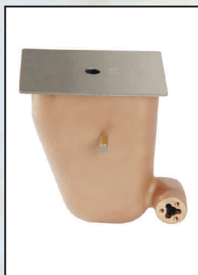
regulator poziomu kod 302147

Montowany razem ze skimmerem. Wyjątkowo trwały pływak zapewnia bezawaryjną pracę na długo.