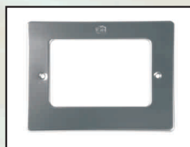
maskownica folia kod 302228 mozaika kod 302236