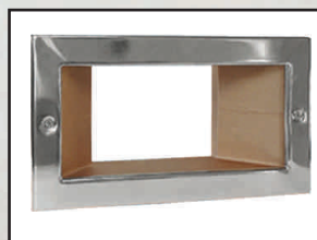
poszerzenie skimmera kod 302515 ramka przednia kod 302520 kołnierz uszczelniający przy folii kod 302525

Umożliwia szybkie zbieranie wody z większej powierzchni. W komplecie śruby i uszczelka do połączenia ze skimmerem.