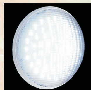
LED Maxi, 2400lm kod 24881