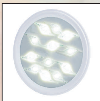
LED biały, 2050 lm kod 24886