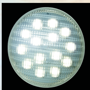
LED 6000K, 1000lm kod 24880