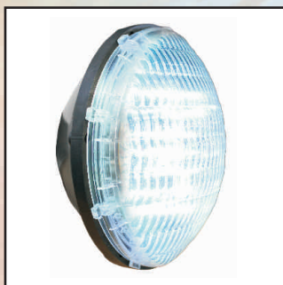
LED 6000K, 1450lm, 25W kod 24870 LED 6000K, 4400lm, 44W kod 24874