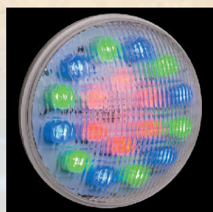
LED Maxi kolor, 920lm kod 24883