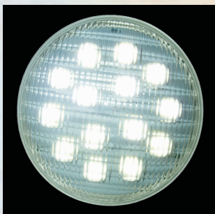
LED 6000K, 1000lm kod 24880