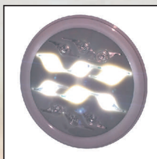
LED biały, 1100 lm kod 24887