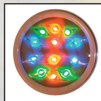
LED kolor, 810 lm kod 24892