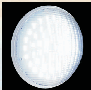
LED Maxi, 2400lm kod 24881