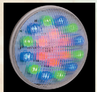
LED Maxi kolor, 920lm kod 24883