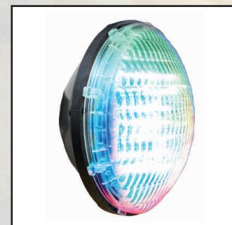
LED kolor, 1150lm, 40W kod 24876