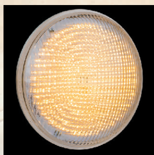
LED 3500K, 1400lm kod 24884