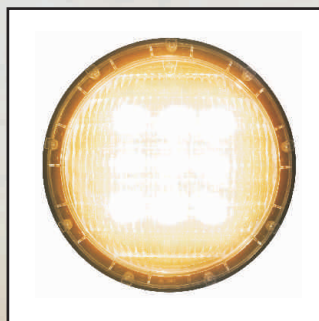
LED 3500K, 1450lm, 25W kod 24872 LED 3500K, 4400lm, 44W kod 24878