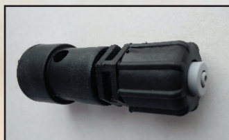
nypel ssący ze zbiornika kod 148072