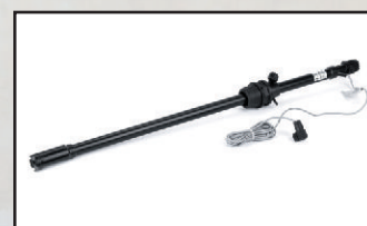
lanca ssaca kod 416694