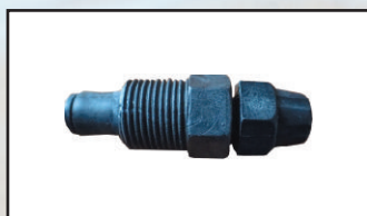
wtrysk GZ \frac{3}{8} " kod 416634