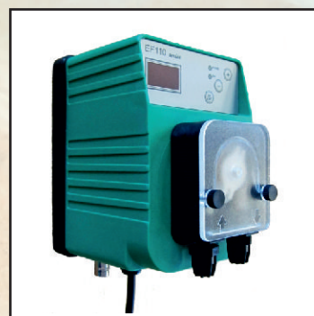
Cyfrowo sterowana z pomiarem EFka 110, max 1,8 l/h kod 25370 zestaw pomiaru pH kod 25372 zestaw pomiaru Redox kod 25374