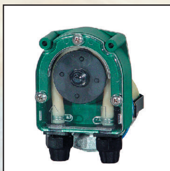
FX maks.2l/h kod 25360