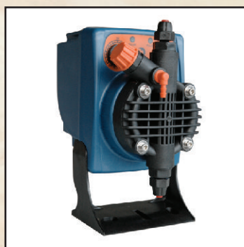
PX maks.5l/h kod 25358