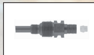
wtrysk GZ \frac{1}{4} " - \frac{1}{2} " kod 416630