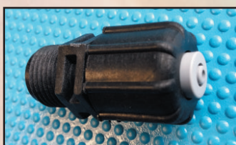
wtrysk GZ \frac{1}{2} " kod 416632