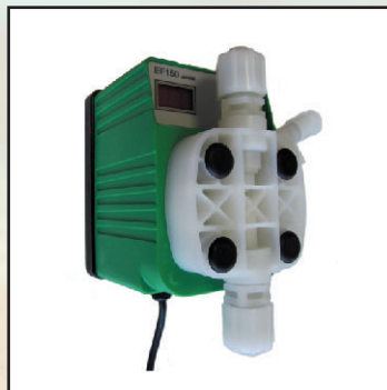
EFka150, maks.10 l/h kod 25364