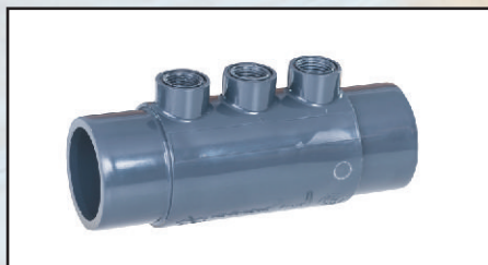
komora elektrod 50/ 63mm x gw \frac{1}{2} " wężyk wody pomiarowej 10 mm zaślepka GZ \frac{1}{2} " kod 416636 kod 8701000 kod 730020