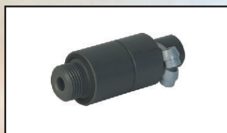
wtrysk GZ \frac{3}{8} " kod 3121010