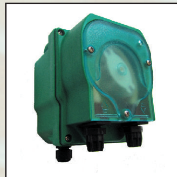
EFka106, maks.4 l/h regulacja wydaj. kod 25368